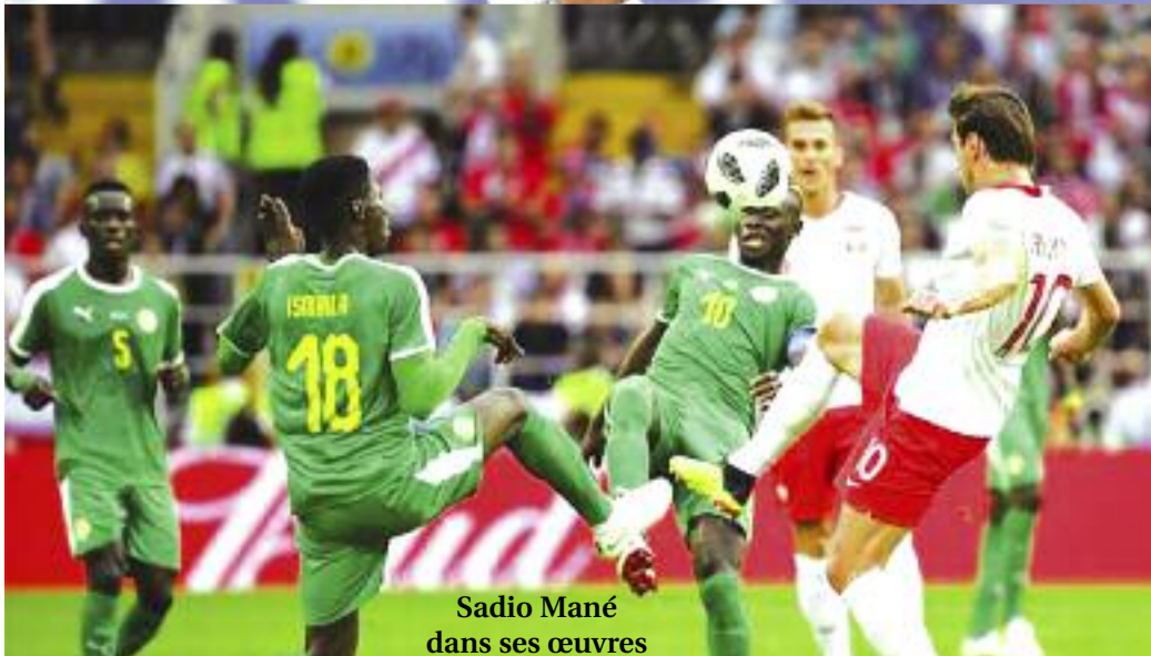
Sadio Mané dans ses œuvres