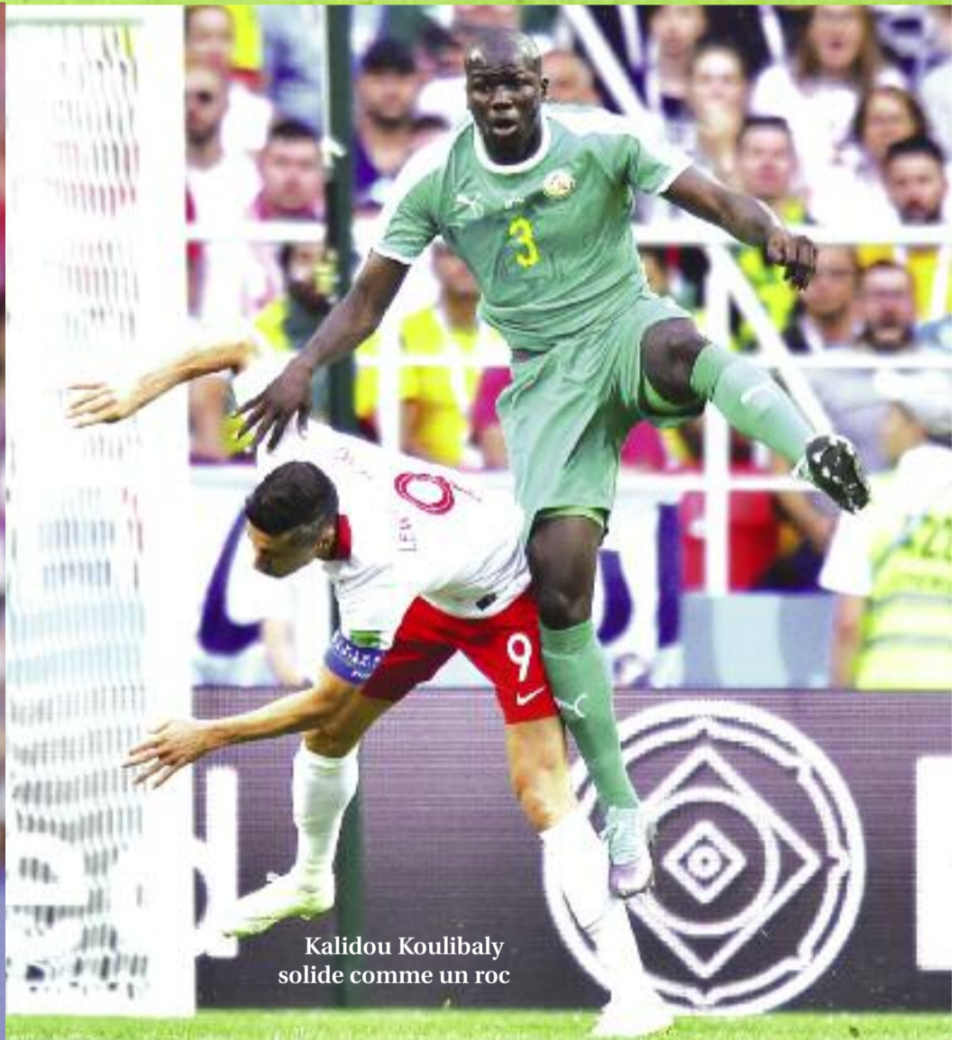
Kalidou Koulibaly solide comme un roc