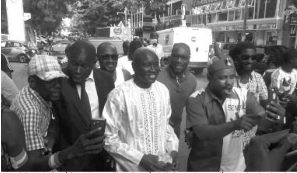
Le ministre de l'Intérieur Aly Ngouille Ndiaye était de la partie pour fêter la victoire des Lions

Dès le coup de sifflet final, les rues de Dakar ont été envahies par une foule en liesse pour fêter en grande pompe la victoire de la bande à Sadio Mané. Des scènes qu'on n'avait pas revues depuis l'épopée glorieuse des Lions en Corée, lors de la Coupe du monde de 2002. Pourvu que ça dure !